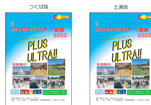
他地域のチラシは コチラ！