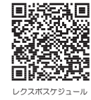
レクスポスケジュール